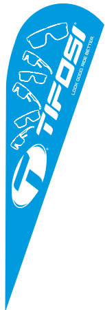
Form A (Teardrop)