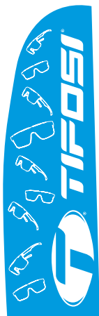
Form B (Straight)